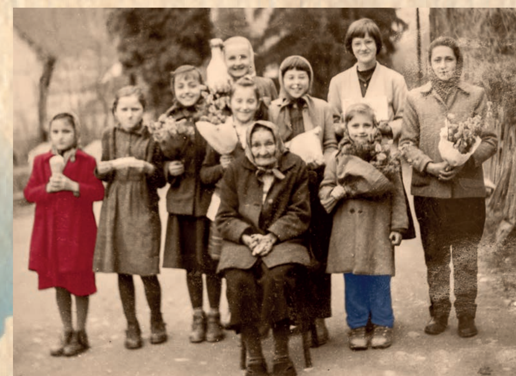
Skrb za ostarele