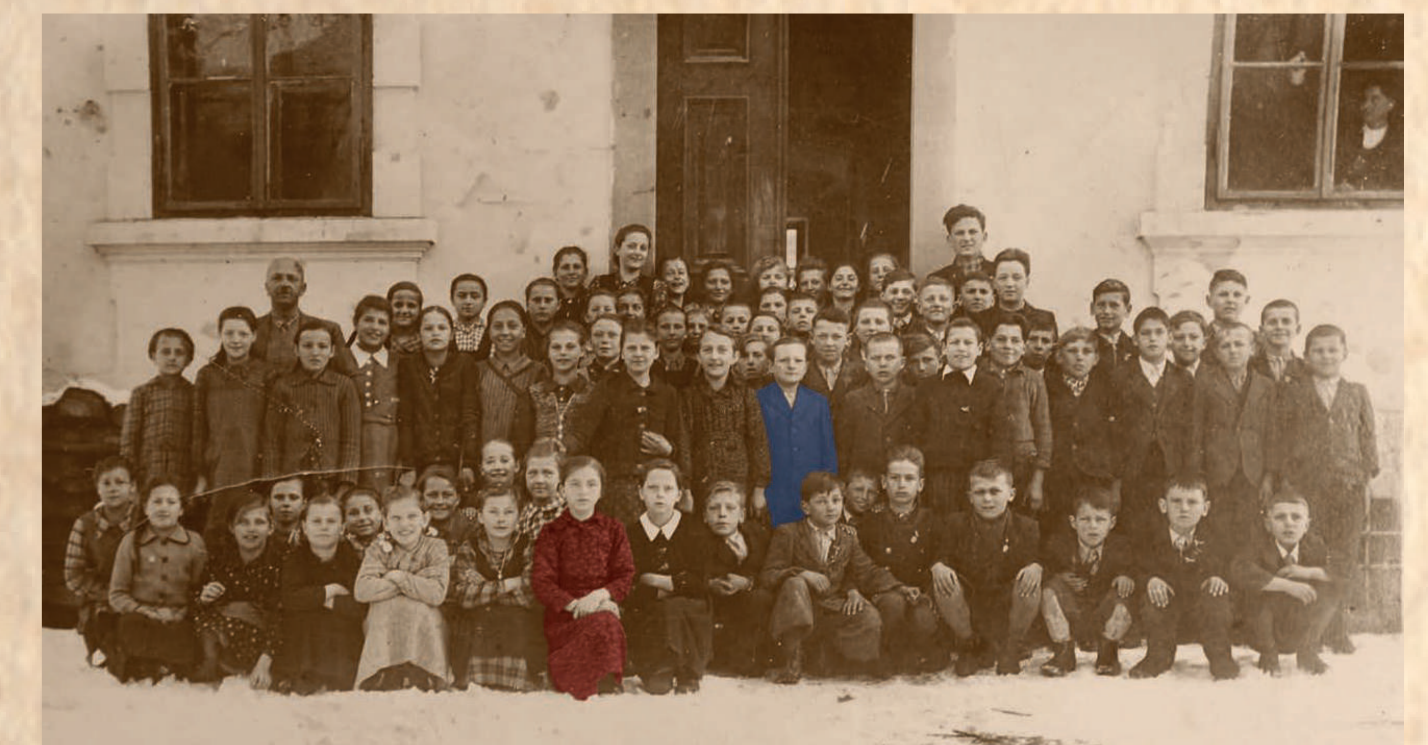
Okoli leta 1940