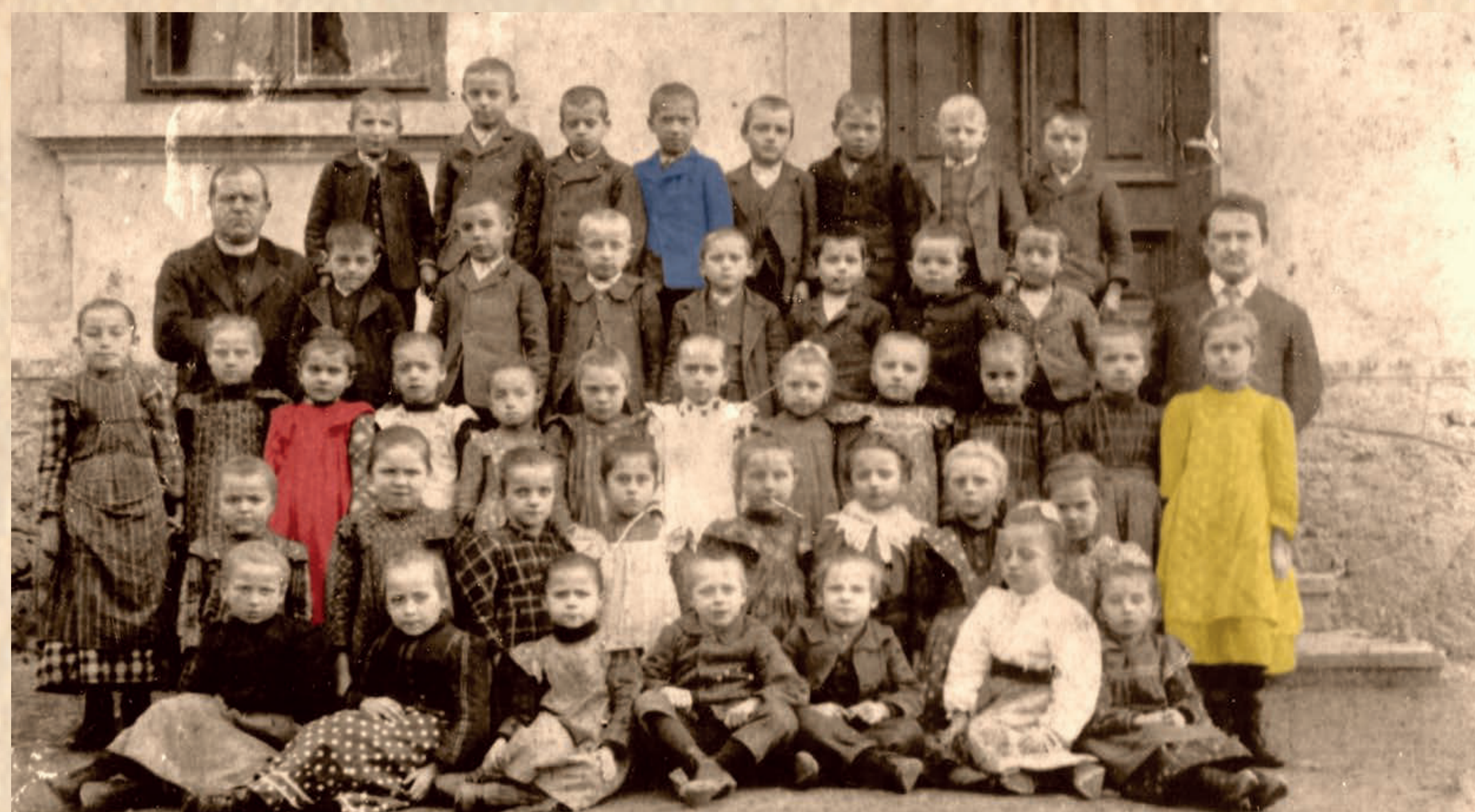
Okoli leta 1910