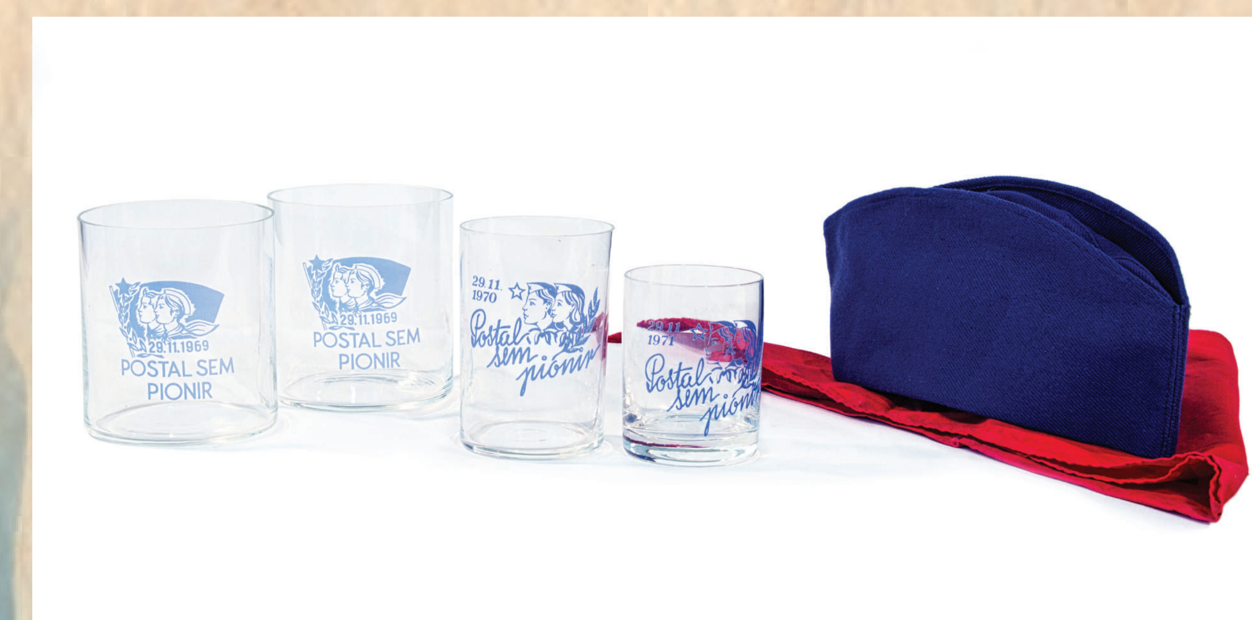
Pionirska čepica in rutica ter spominski kozarci iz Podčetrтка