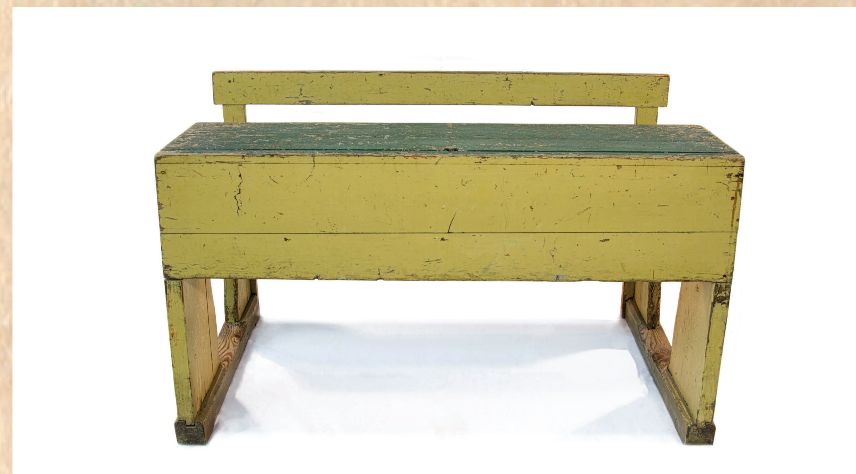
Šolska klop iz začetka 20. stoletja