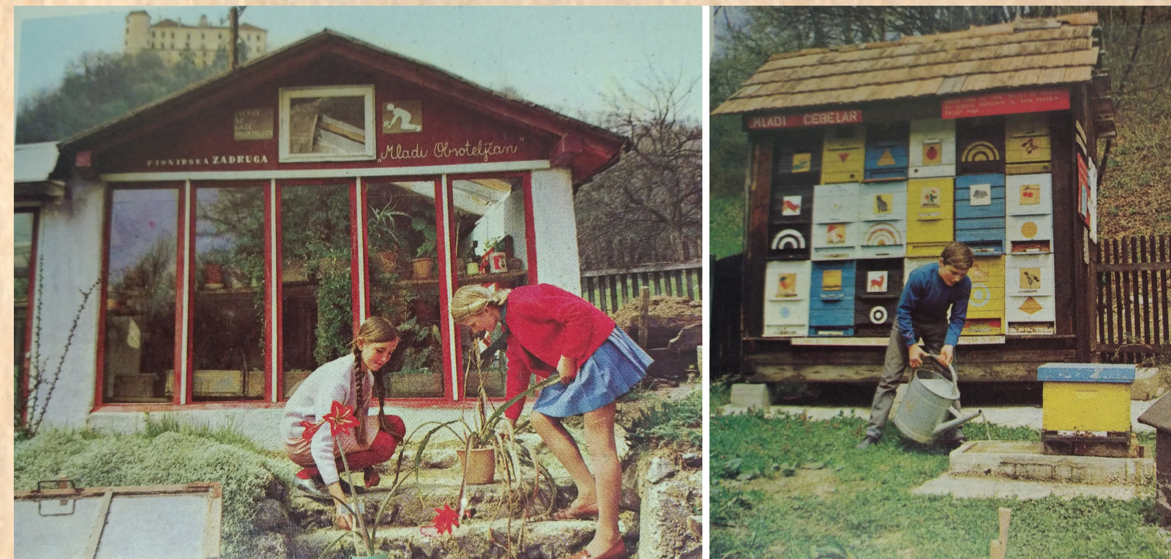
Šolski cvetličnjak in čebelnjak